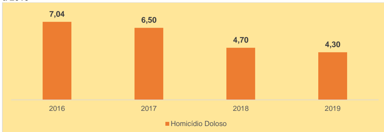
Gráfico 2 - Taxa de homicídio doloso por cem mil habitantes, São Bernardo do Campo, 2016 a 2019