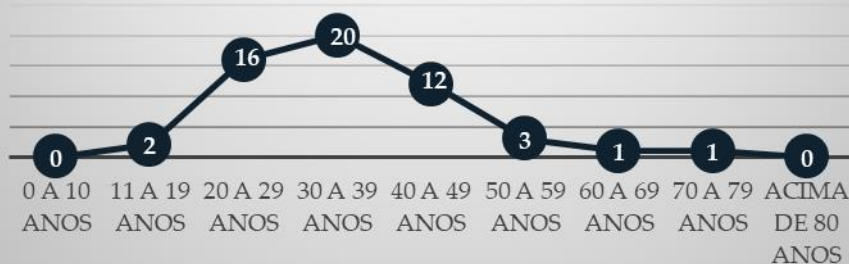
Casos de Monkeypox, residentes SBC, por faixa etária, 2022