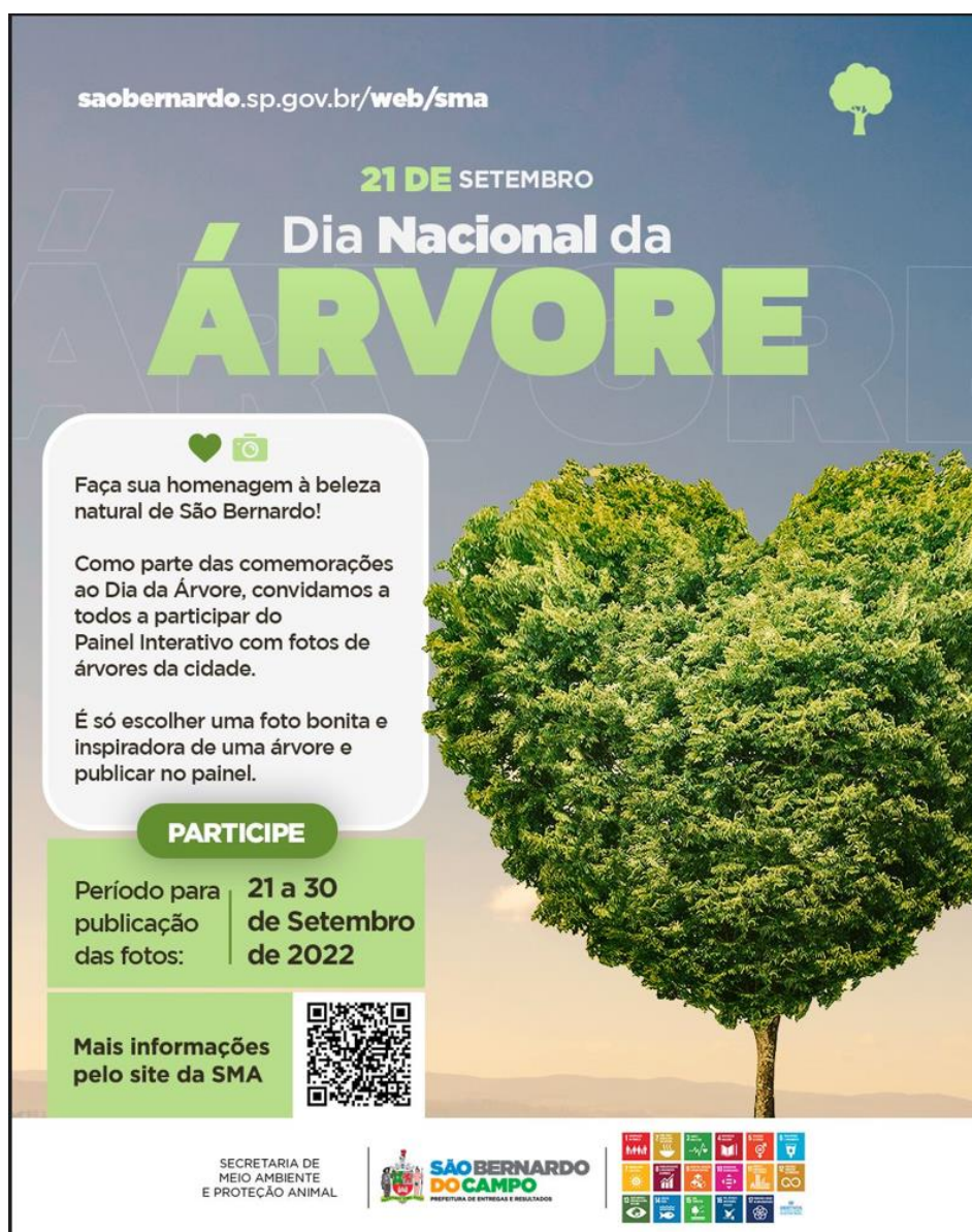
Figura 2: Arte de divulgação do painel para mailing e WhatsApp