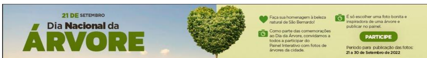
Figura 1: Arte de divulgação do painel

A divulgação do painel foi realizada por meio de publicação de banner de destaque no site da Prefeitura, banner de destaque no Portal da SMA, envio de e-mail para todos os endereços @saobernardo.sp.gov.br, envio de e-mail para endereços cadastrados no Departamento de Gestão Ambiental e publicação de postagem no Facebook da Prefeitura.