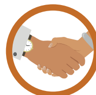
CONTATO FÍSICO COM PESSOA INFECTADA