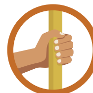
CONTATO COM SUPERFÍCIES CONTAMINADAS

Seguido de contato com boca, nariz e olhos.