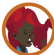
GOTÍCULAS DE SALIVA