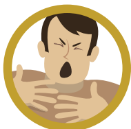
DIFICULDADE PARA RESPIRAR

Além disso, outros sintomas como cansaço, dores, corrimento e congestão nasal, dor de garganta e diarreia podem ocorrer.