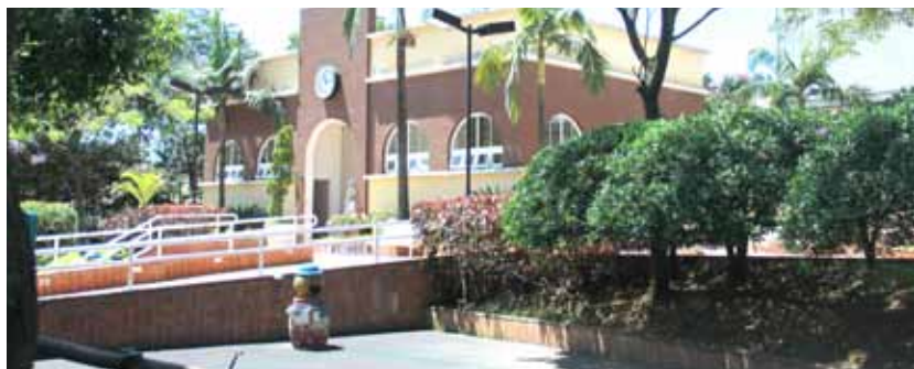
Parque Salvador Arena