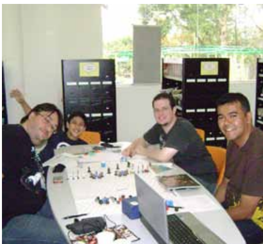
Sessão de Role-Playing Game na Gibiteca Eugênio Colonnese

Sigla de Role-Playing Game, RPG são jogos com variáveis distintas que podem ser classificados por "tipo". É uma partida de interpretação na qual existe o desenvolvimento