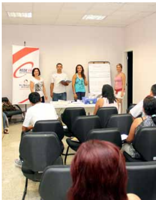
Sala do Empreendedor promove em parceria com o Sebrae palestras e cursos

Conhecimento para o enquadramento como microempreendedor individual. Orientações sobre vantagens, benefícios e contratação de mão de obra. Capacitação para a legislação específica e elaboração de relatórios mensais (livro caixa e livro