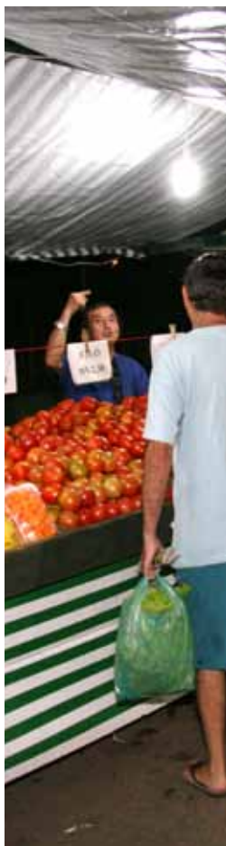
Feira Noturna no Anchieta e no Rudge

■ Quintas, das 18h às 22h – Rudge Ramos, Praça dos Meninos, Avenida Caminho do Mar.