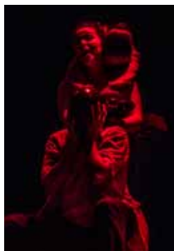
Sombras de uma Escola Pânica

■ Dias 20, 21, 22, 27, 28 e 1 de março, às 19h