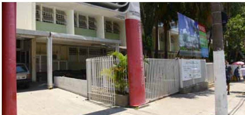
Prédio do Ambulatório de Especialidades Médicas I dará lugar à nova Policlínica Centro, que reunirá diversos serviços de saúde

A Prefeitura de São Bernardo do Campo iniciou, no mês passado, a reforma e ampliação do prédio localizado na Avenida Armando Ítalo Setti, 402, onde hoje funciona o Ambulatório de Especialidades Médicas I. No local será instalada a Policlínica do Centro. A unidade será o maior centro de especialidades ambulatoriais da rede municipal e reunirá o atendimento em todas as áreas médicas (adulto e pediatria), além de centro de fisioterapia