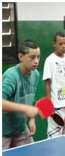
Nas férias, projeto atende todas idades

■ Bunka. Aulas: terças e quintas, das 13h30 às 16h30