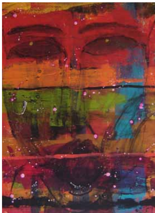
Obra Olhar , do artista Betto Damasceno

A Pinacoteca de São Bernardo promove a exposição Exclusão, Contestação e Resistência . São 43 obras