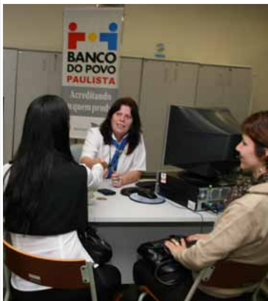
Banco do Povo Paulista oferece crédito com juros de 0,35% ao mês