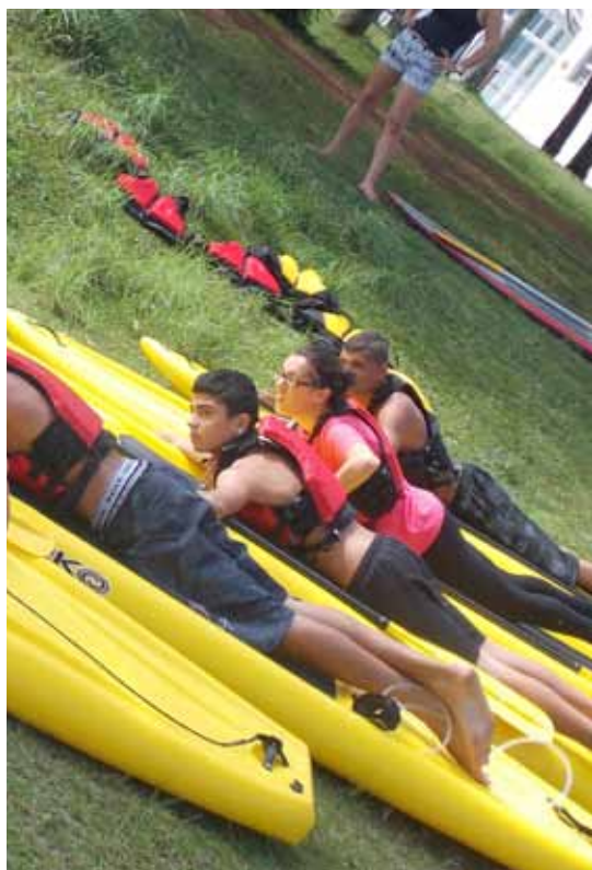
Projeto Remando para a vida é desenvolvido em águas da Represa Billings

Projeto inovador na área da saúde mental com atividade física em águas da Represa Billings cujo objetivo é promover ação e aventura para crianças, adolescentes e adultos dos serviços do Caps. A atividade produz iniciativas terapêuticas com enfoque