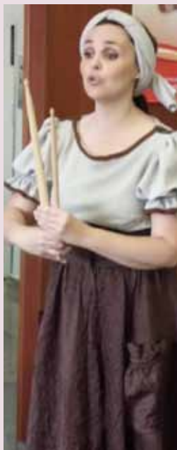
O gato Malhado e a andorinha Sinhá