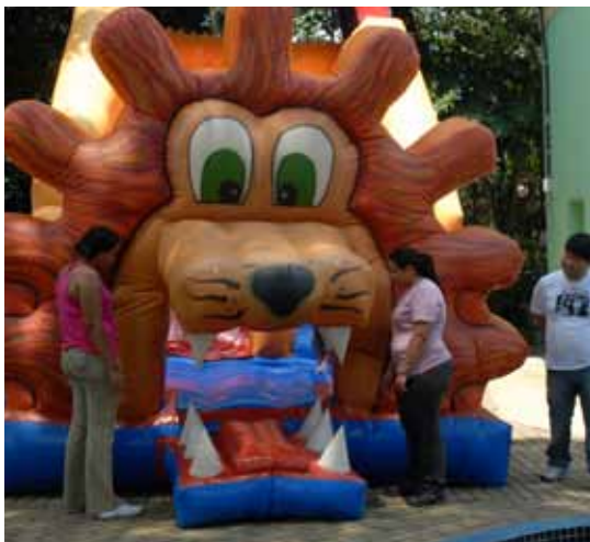
Cidade da Criança