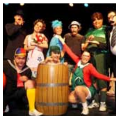
Turma do Chaves Muito mistério e diversão ao longo da peça

A turma do Chaves está em cartaz no Teatro Lauro Gomes