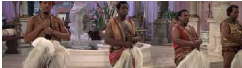
A história do mundo – Parte I, de Mel Brooks