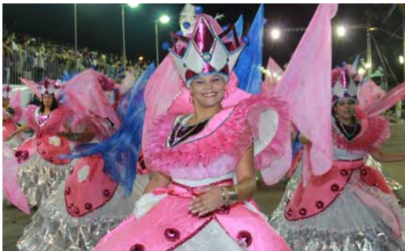
Desfile da União das Vilas, campeã do Carnaval do ano passado

São Bernardo do Campo está em ritmo de Carnaval. No total, nove agremiações, sendo divididas entre Grupos I e II, irão mostrar o samba no pé na passarela. O bloco de afoxé Omo Ayie Sele irá realizar a abertura oficial do evento, que acontecerá em uma casa de show no Riacho Grande (Rua Nevio Carlone, 3, km 33 da Estrada Velha de Santos). Esta será a primeira arena coberta do Estado de São Paulo a receber a