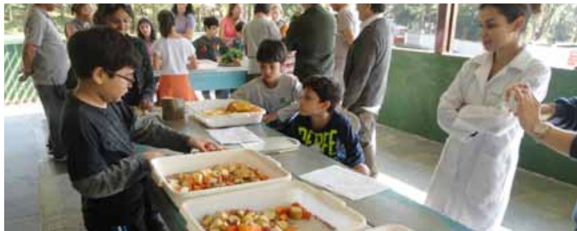
Visitante terá a oportunidade de conhecer e preparar a alimentação de animais do Zoológico do Parque Estoril