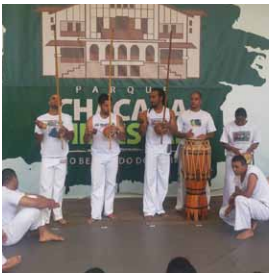
Rodas de capoeira são atrações em São Bernardo do Campo