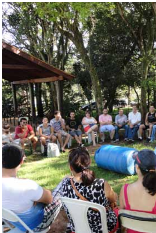
Atividade da Escola Livre de Sustentabilidade com visitantes do Estoril