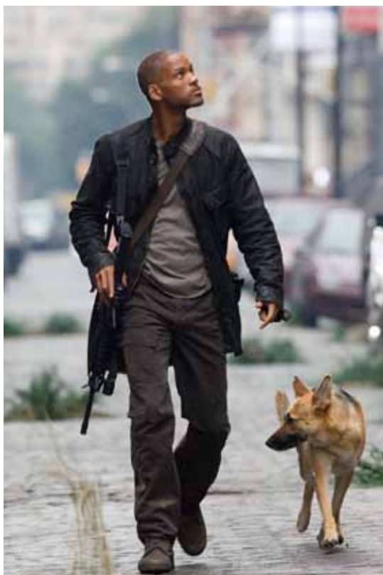
Will Smith em Eu sou a lenda

Direção: Francis Lawrence. EUA (2008), 100 min.