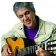
Caetano Veloso Curtas resgatam personalidades

Cineclubes de SBC retratam diversidade de ritmos brasileiros