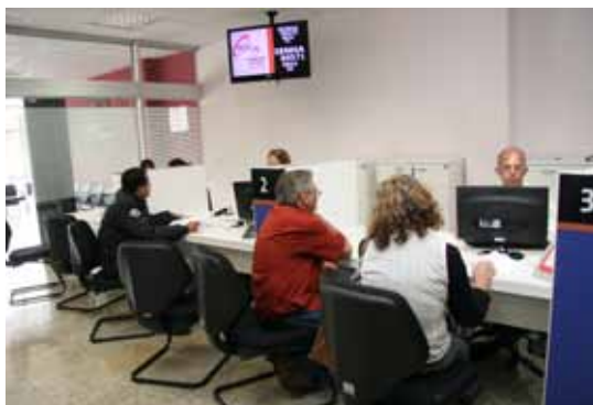
Sala do Empreendedor oferece serviços de várias secretarias interligados à Rede Fácil

Sindicato das Empresas de Serviços Contábeis e das Empresas de Assessoramento, Perícias, Informações e Pesquisas do Estado de São Paulo. Serviços: orientações e formalização de empreendedores individuais no