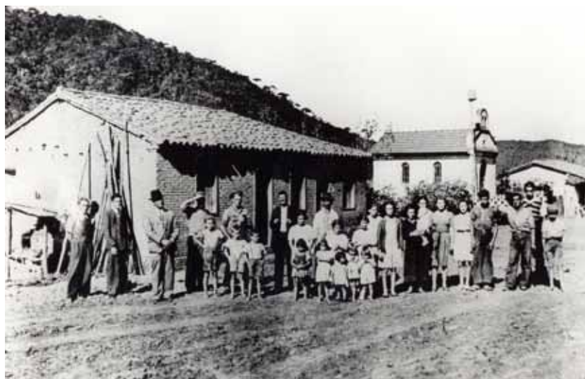
Sítio da Ponte Alta, próximo ao atual Jardim Silvína, de onde se tem as primeiras referências históricas da região. Na foto aparecem diversos membros da família Angeli, antiga proprietária do local. 1940.