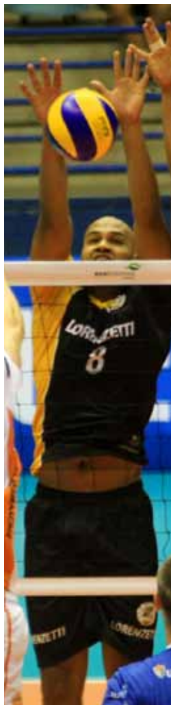
Jogador de vôlei do São Bernardo