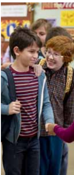
Diário de um banana 2

Direção: David Bowers. EUA (2011), 100 min. Greg, o rapaz protagonista do primeiro filme da série, cresceu um pouco, mas vive se metendo em confusão. Se já não bastassem seus próprios problemas, seu irmão mais velho resolve complicar ainda mais a sua vida. Com Zachary Gordon, Devon Bostick e Rachael Harris. Livre/Grátis.