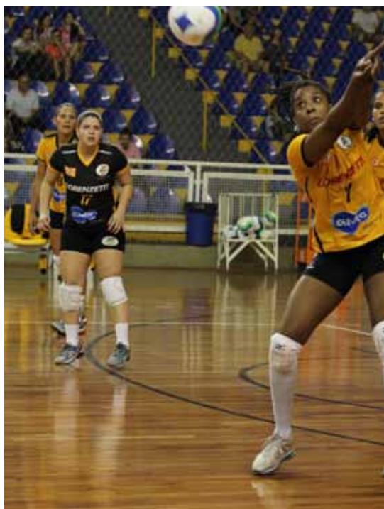
São Bernardo Vôlei enfrenta dia 24 o time de São José dos Campos no Poliesportivo

Oferece a oportunidade de iniciação, de forma prazerosa, na modalidade para crianças e jovens da cidade com idade entre 7 e 13 anos. A novidade é que durante o período de férias o projeto abrirá as portas para que moradores