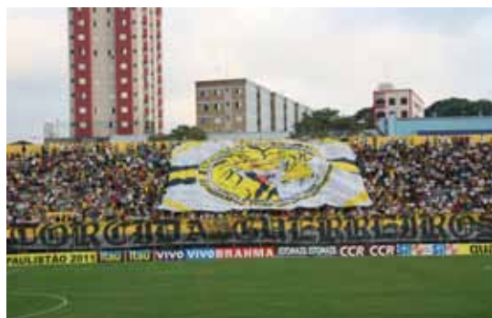
Tigre busca acesso à Série D do Campeonato Brasileiro de 2015