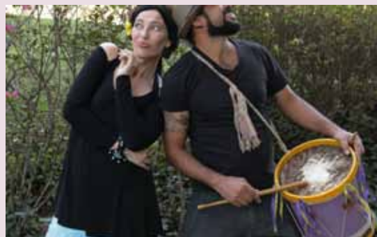
Aquilo que o velho fizer está bem feito