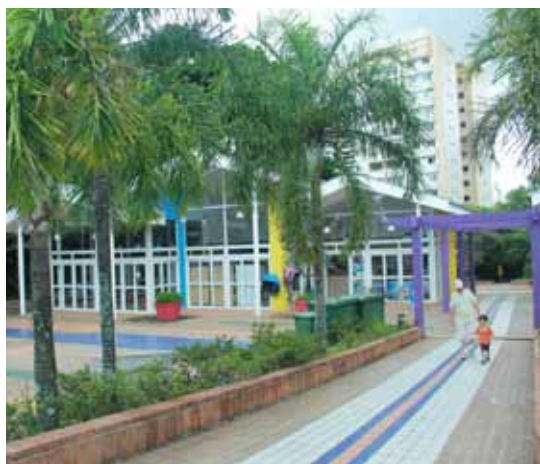
Parque Municipal Raphael Lazzuri