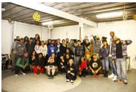
Coletivo de Hip Hop promove na última quinta-feira do mês Sarau do Fórum

Mostra em homenagem ao Dia do Quadrinho Nacional, comemorado em 30 de