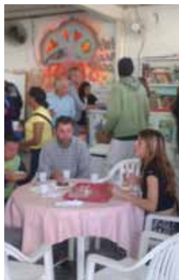
Festa para os aniversariantes do mês