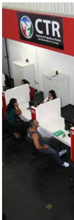
CTR, agência pública de emprego

Inaugurada em 2010, a Central de Trabalho e Renda (CTR) de São Bernardo disponibiliza vagas de empresas e oferece gratuitamente recolocação