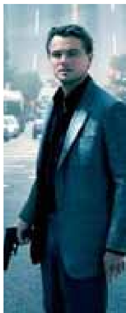
Leonardo DiCaprio em A origem