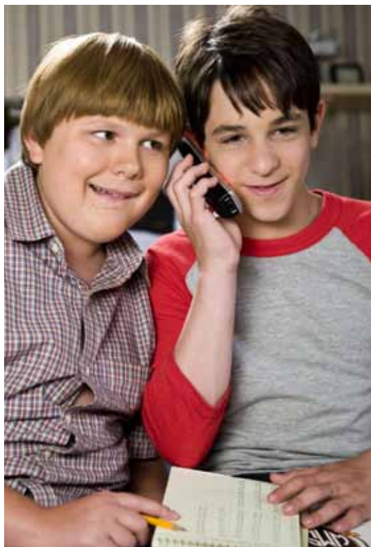
Diário de um banana 3