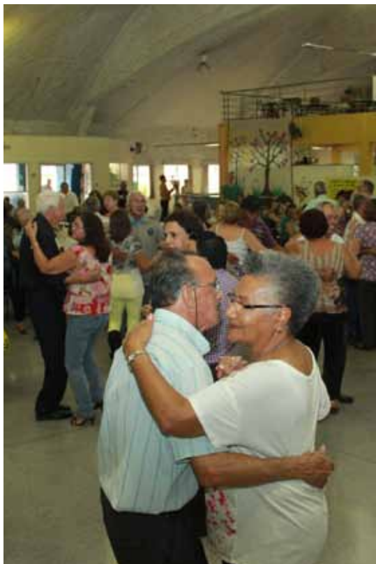
Centro de Referência do Idoso promove bailes aos domingos. Traje: esporte chique