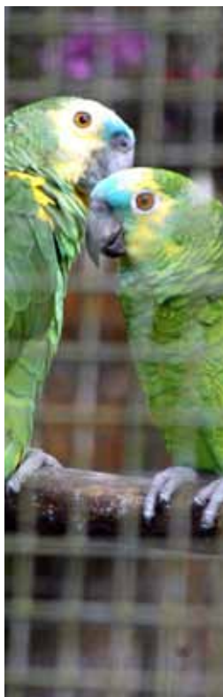
Zoológico Municipal de São Bernardo

mantém em exposição cerca de 270 animais de 70 espécies da Mata Atlântica, como anta, tamanduá mirim, papagaio de peito roxo, tucano de bico verde, jacaré de papo amarelo, jiboia, jaboti, espécies ameaçadas de extinção (jaguatirica, eleita mascote do parque, e tamanduá bandeira). Oferece atividades de educação ambiental e