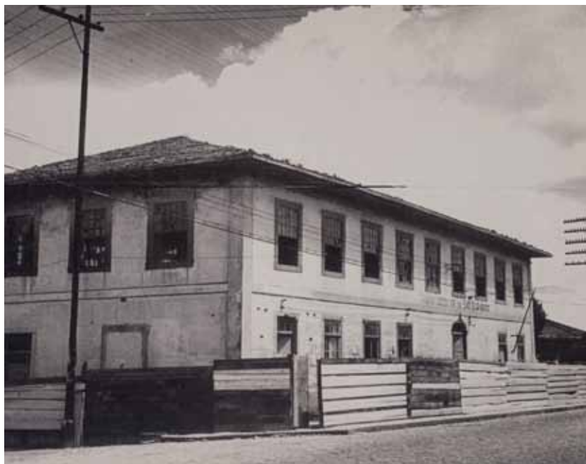
O casarão em 1951, pouco antes de sua demolição.

Construído no início do século XIX para ser a moradia do Alferes Francisco Martins Bonilha, rico produtor de chá e figura influente na então Freguesia de São Bernardo, este casarão situava-se defronte à estrada do mar, hoje Rua Marechal Deodoro, no ponto onde atualmente está a Praça Lauro Gomes. Bonilha recepcionou nele, durante anos o maior edifício da localidade, viajantes