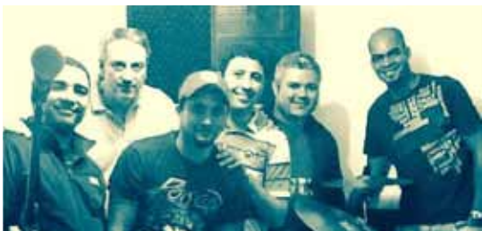
Proetti e Nostalgia Rock Band