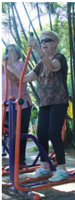
Academia na Praça dos Meninos

Um dos cartões postais da cidade, oferece pista de caminhada, playground, equipamentos de ginástica, espelhos d'água, luminárias, coreto, vegetação e um lago com carpas. Situada no Rudge Ramos, embeleza uma das principais avenidas do bairro com estilo e decoração que remetem ao país do sol nascente.