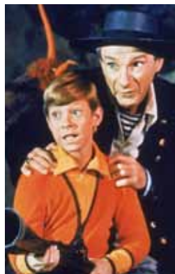
Série de ficção Perdidos no Espaço