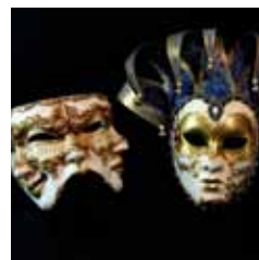
Máscaras de Carnaval Oficina homenageia tradição popular

Oficina ensina como fazer máscaras de Carnaval