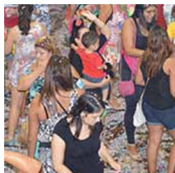
Tradicional baile da Associação

A Associação dos Funcionários Públicos de São Bernardo do Campo realiza festas carnavalescas desde 1958. Na década de 1960 as decorações passaram a ser feitas por cenógrafos. No livro "Os 50 anos da Associação", Ademir Medici conta que os bailes do clube eram chamados de "monumentais". Nos dias 15, 16 e 17, das 15h às 18h, haverá as matinês no Salão Social. No dia 17, após a matinê, haverá a Noite de Carnaval para adultos. O evento acontece a partir das 20h no mesmo local. Gratuitos para associados. Os eventos são abertos para convidados desde que apresentados por sócio mediante a compra de convites. Mais informações pelo telefone 3531-4366.