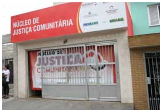
Núcleo de Justiça Comunitária promove solução de conflitos na comunidade