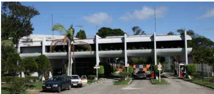
Parque Natural Municipal Estoril

Primeira unidade de conservação une Mata Atlântica, Represa Billings e fauna silvestre. Conta com academia de ginástica, Capela de São Bartolomeu, lanchonete, zoológico e atividades de educação ambiental. São oferecidas visitas monitoradas para escolas e grupos (agenda pelo telefone 4367-6461). Entrada gratuita para morador com carteirinha do parque, que pode ser feita na administração do local (uma foto 3x4, CPF, RG e comprovante de residência). Entrada: R$ 3 (pedestre e pessoas no veículo). Estacionamento: R$ 10 (carro e moto), R$ 20 (micro-ônibus e vans) e R$ 300 (ônibus). Telefones: 4354-9087 e 4354-9318.