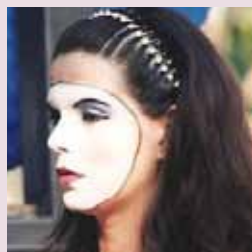
As mil e uma noite