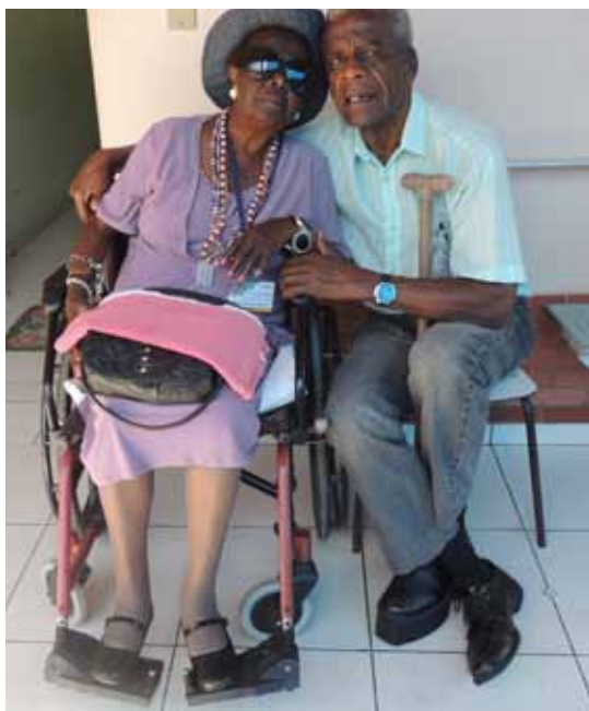
Casa São Vicente de Paulo