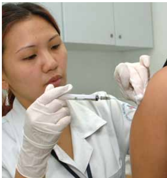
Campanha de vacinação contra gripe comum e Influenza A/H1N1