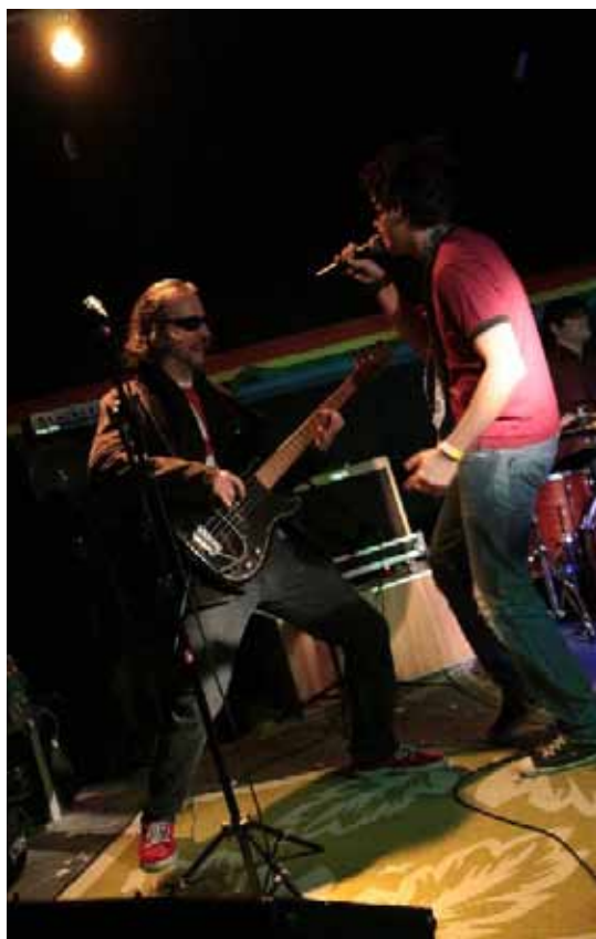
The Rolling Stones Tribute Brazil

para estudantes, pessoas com 60 anos ou mais, aposentados, funcionários públicos e professores da rede pública). Teatro Lauro Gomes.