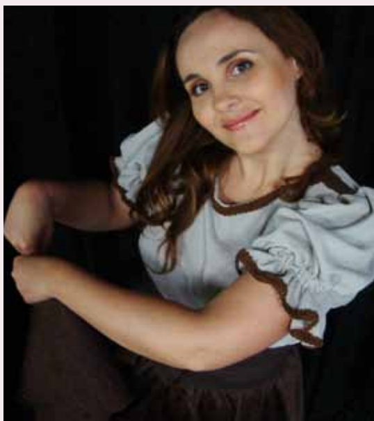
Nosso Grupo de Teatro