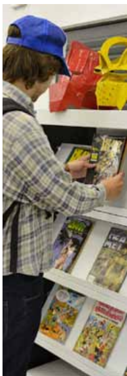
Biblioteca Eugênio Colonnese