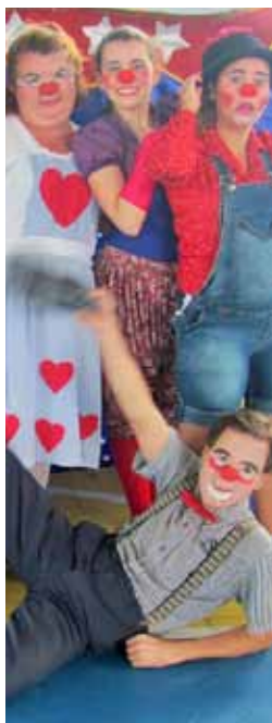
Teatro infantil na Cidade da Criança