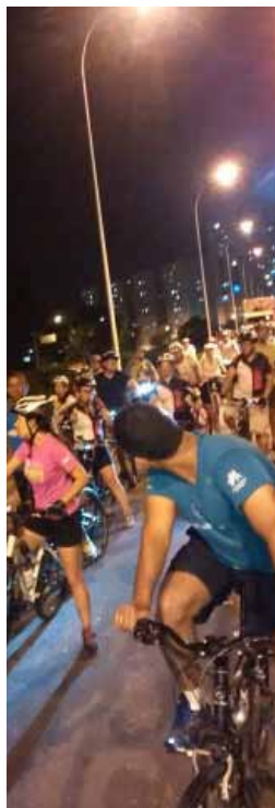
Pedalada noturna será nos dias 23 e 30

iluminação e sinalização das bicicletas. Menores de 16 anos deverão estar acompanhados de um adulto responsável. Caso chova uma hora antes do evento, o passeio não acontecerá. As secretarias de Segurança Pública e de Trânsito escoltam os ciclistas. Nos dias 23 e 30, a pedalada acontece a partir da Praça Giovanni Breda, nos mesmos horários. Informações pelos telefones 4129-5619 ou 4126-5657.