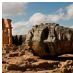
Cultura centenária Homenagens incluem corais, filmes, livros etc.