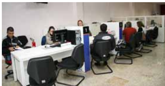
Atendimentos na Sala do Empreendedor

Sindicato das Empresas de Serviços Contábeis e das Empresas de Assessoramento, Perícias, Informações e Pesquisas do Estado de São Paulo. Serviços: orientações e formalização de empreendedores individuais no Portal do Empreendedor. Mediante agendamento prévio.