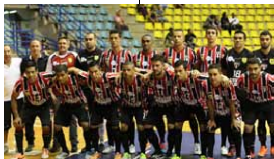
ADC São Bernardo/São Paulo