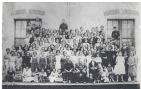
Na foto, funcionárias da Companhia Tecelagem de Seda “Villa de São Bernardo”. Início do Século XX. Acervo Seção de Pesquisa e Documentação – PMSBC.

meio de textos e fotos, panorama da longa trajetória da atividade industrial na cidade, enfocando desde a agricultura até a chegada das grandes montadoras automobilísticas. Concomitantemente à industrialização, e em razão desta, o movimento operário vai tomando forma e se configurando como um agente importante na dinâmica local, com repercussões que extrapolam o município. Câmara de Cultura Antonino Assumpção.