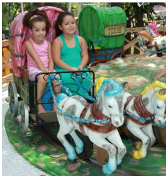
Cidade da Criança

Atrações para adultos e crianças (Túnel do Terror, Minimontanha-russa, Car-