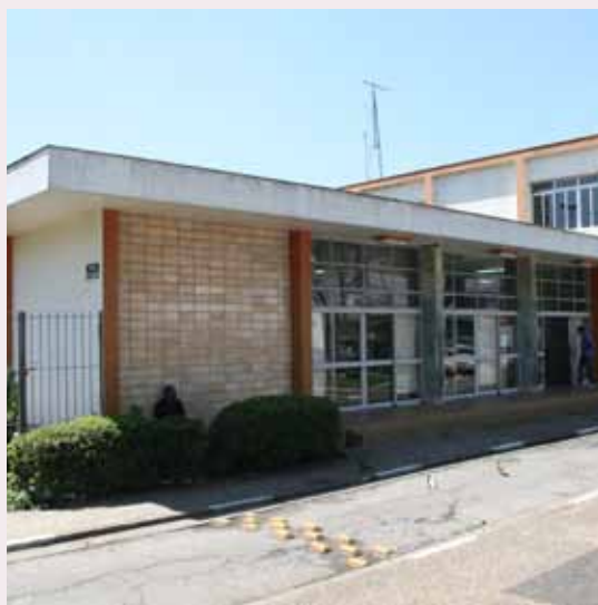
Clubinho Amigos da Leitura é realizado na Biblioteca Monteiro Lobato

A peça, inspirada no conto Os Músicos de Bremen,