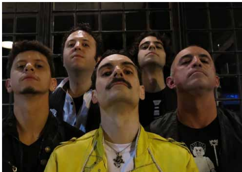
Grupo Queen Rocks tocará clássicos da banda britânica, imortalizada na voz de Freddie Mercury