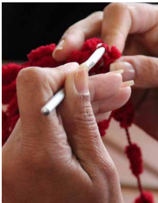
Oficina de crochê

15. Valor do kit: R$ 16. Obs.: levar tesoura com corte.