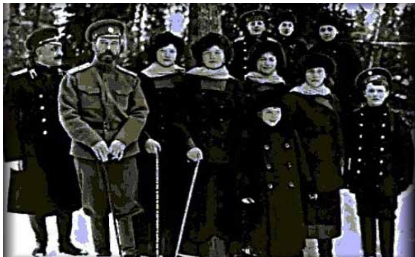
Eles se atreveram