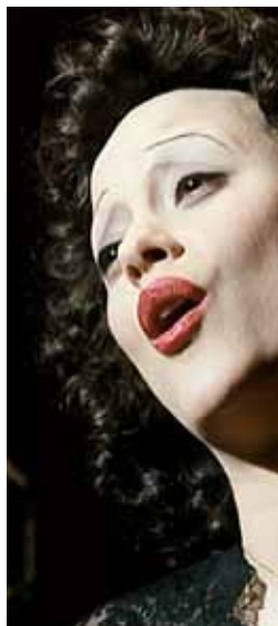
Piaf - Um hino ao amor