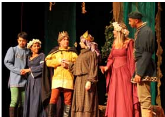
Auto da barca do inferno