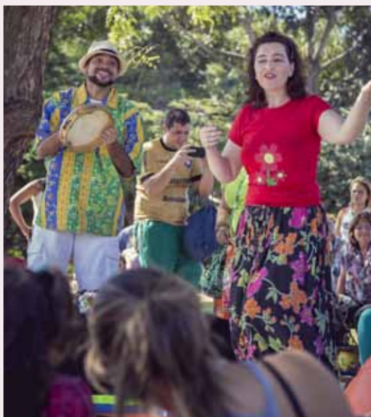
Grupo Cia Duo Encantado