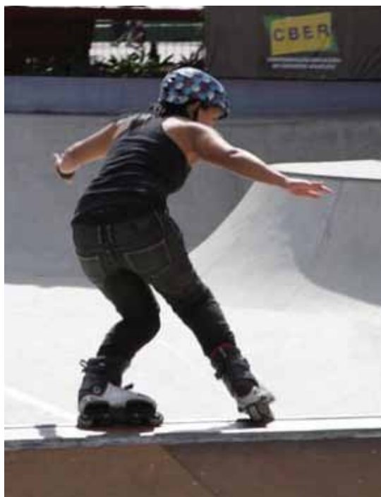
Corujão in line

Com o objetivo de consolidar o Arena Banks como melhor evento de BMX nacional, com expansão internacional, importan-