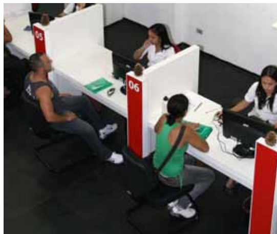
Central de Trabalho e Renda é a agência pública de emprego de São Bernardo

Inaugurada em 2010, a Central de Trabalho e Renda (CTR) de São Bernardo disponibiliza vagas de empresas e oferece gratuitamente recolocação