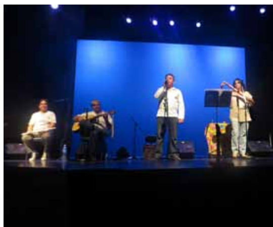
Ensaio aberto do Viola Banguá

O projeto Som & Café é um espaço intimista com cadeiras espalhadas pelo salão aconchegante, música instrumental para a plateia e café quente à disposição do público. O evento independente acontece toda última segunda-feira do mês. Neste local democrático e de interação