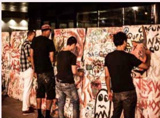
ONG Skate Solidário promove intervenções artísticas para alunos da comunidade

A alegria do circo toma conta de São Bernardo. O Parque Raphael Lazzuri, no Bairro Anchieta, volta a receber os coletivos de circo da cidade. Todos os sábados e domingos, às 15h, a Prefeitura abre o local para que palhaços, malabaristas, acrobatas e mágicos se apresentem gratuitamente à população. O espaço possui arena para exposições, arquibancadas e recebe pessoas de todas as idades. O objetivo é incentivar esta arte por meio do oferecimento de um espaço público para que artistas da região, profissionais e amadores, se apresentem. Durante o show, a tradição circense de passar o chapéu é realizada, representando uma relação economicamente sustentável entre