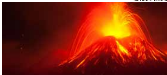
Etna é o mais alto vulcão da Europa

Direção: Alberto Sironi. Itália (2013), 104 min. O comissário Montalbano prende um jovem durante patrulha de rotina, mas o ladrão pertence à família de um político influente criando problemas para o comissário. Pinacoteca de São Bernardo. 12 anos.