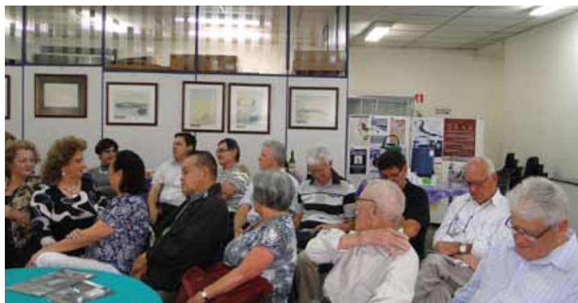
Conversas de Memória