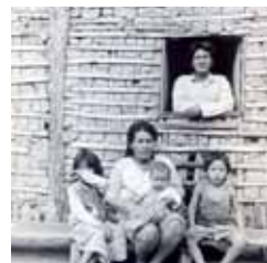
Índios do ABC: exposição pode ser vista no casarão da Chácara Silvestre

Fim de semana terá espetáculos de circo no Raphael Lazzuri