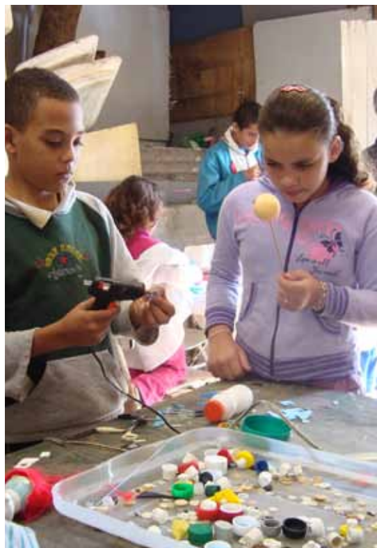
Mãos à obra nas oficinas culturais

■ Inscrições: de 1 a 11, no local da oficina, de segunda a sexta, das 10h às 17h, e sábado, das 10h às 12h.