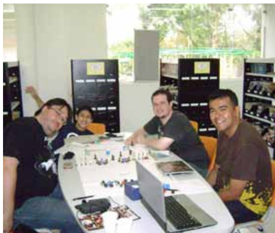
Partida de RPG

■ De segunda a sexta, das 9h às 18h, e sábado, das 8h às 14h