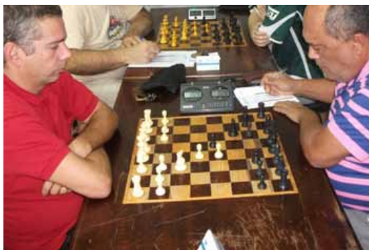
Partida de xadrez

O Parque Chácara Silvestre será palco da abertura da temporada 2015 da Copa Bardahal de Automodelismo 4x4, categorias “passeio” e “regularidade”. O participante deverá demonstrar toda sua destreza ao pilotar seu veículo automodelo off-road em meio aos obstáculos naturais (troncos, galhos, poças de lama, pedras, inclinações, entre outros) do trajeto proposto pela produção do evento. Vence quem conseguir realizar o circuito em menor tempo. Informações pelo email petenati34@gmail.com ou 99912-1294. Grátis/Livre. Parque Chácara Silvestre. Confira o cronograma.