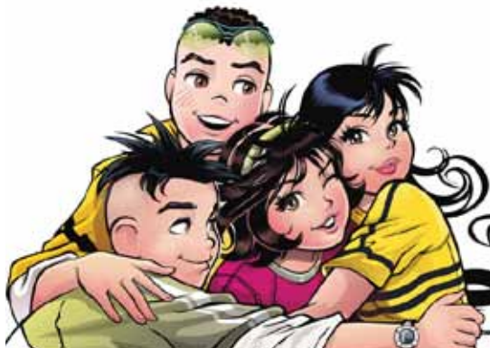
Leitura compartilhada do gibi Turma da Mônica Jovem

Leitura compartilhada com o gibi Turma da Mônica Jovem. Devido a sua diversidade de linguagem e riqueza artística, as histórias em quadrinhos favorecem a fluência da leitura e a compreensão de textos, além de possibilitar momentos prazerosos. A partir de 9 anos. Livre/Grátis. Biblioteca Monteiro Lobato.