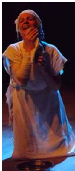
Bendita entre as mulheres