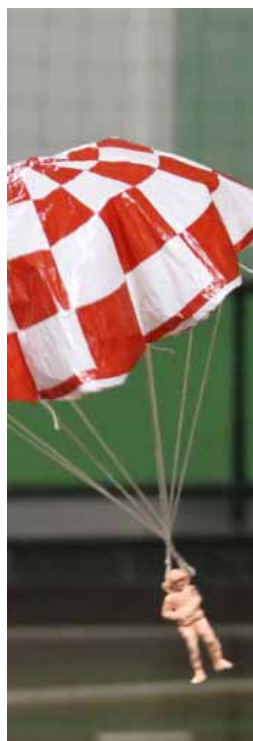
Vá e leve seu aeromodelo

Para participar do encontro basta comparecer à Praça de Eventos e levar o seu aeromodelo elétrico. Se for iniciante, poderá pedir auxílio aos pilotos presentes ou fazer aulas de voo com cabo simulador acoplado ao rádio do piloto mais experiente para poder sentir qual é a sensação de voar com os pés no chão. Nestes encontros será possível também conhecer um pouco mais sobre os aeromode-