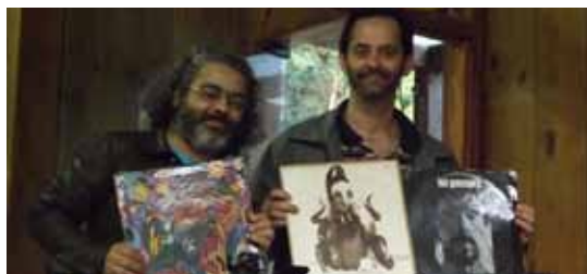
Coletivo Azul Vinil