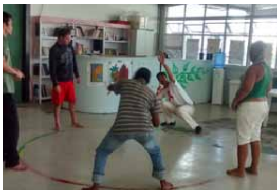
Atividade do Consultório de Rua