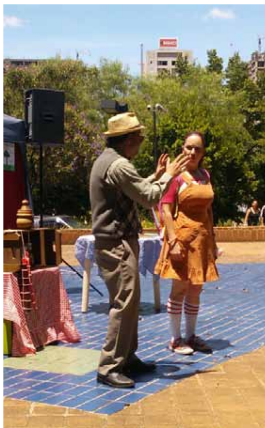
Atividade da Ciranda da Sustentabilidade

No mês de abril, a Ciranda da Sustentabilidade está em dois parques da cidade com a peça de teatro Um piquenique no Parque. De forma lúdica e recreativa, o programa busca despertar nos visitantes a importância do ambiente natural por meio de jogos lúdicos, contação de histórias, peças teatrais e vivências ambientais para crianças e jovens. Se divirta e aprenda com a mascote do Parque Estoril e sua turminha! Público: crianças e jovens frequentadores dos parques. Menores de 12 anos poderão participar acompanhados dos pais