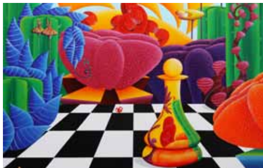
Semiótica dos afetos