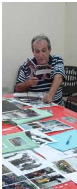
Conversas de Memória no Paulicéia