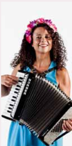
Grupo Ginga e Prosa