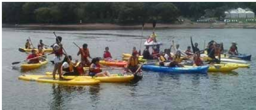
Atividade nas águas da Represa Billings do programa Remando para a Vida

■ Quartas, das 13h às 17h, quintas e sextas, das 9h às 12h e 13h às 17h