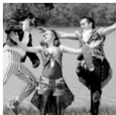
Ocupação no parque Circo e malabares alegrarão adulto e criança