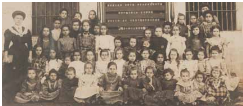
Uma das cinco escolas isoladas existentes na sede do município de São Bernardo em 1909.