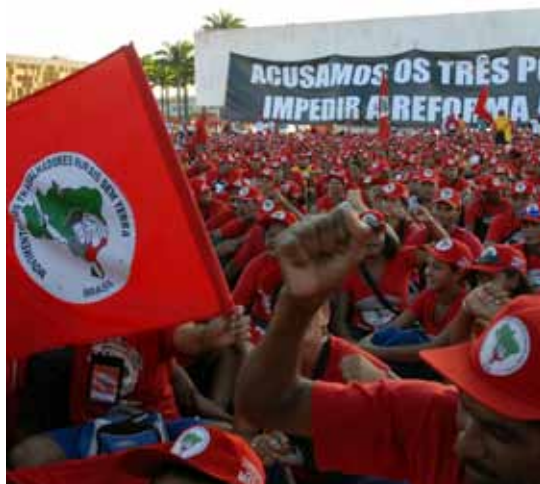
Uma luta de todos: o MST pelo MST

Produção: CPT/Rede Social de Justiça e Direitos Humanos. Brasil (2006), 43 min. O documentário mostra a construção de uma nova sociedade pelas famílias de trabalhadores