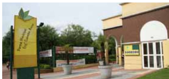
Parque Salvador Arena

Tem como atrações aquário de água doce, com diferentes espécies de peixes e um dos maiores do Brasil, pista de caminhada, lago com chafariz, cascatas artificiais, teatro de arena, playground, área para atividades físicas e contemplação,