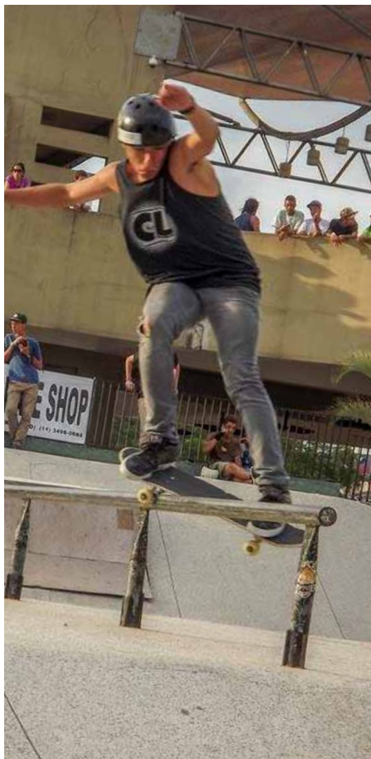
Gold Skate Street