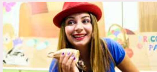
Grupo Tricotando Palavras

Autor: Kaká Werá Jecupé. "O Pajé e o Ratinho" narra a história de um ratinho que morria de medo de tudo, até mesmo da própria sombra, então pede ao Pajé que o transforme em diversos bichos e até mesmo em um pajé. Em "A Onça e a Anta" conta que um dia a onça-rei resolveu construir sua casinha. E no mesmo dia a Anta pensou a mesma coisa. Sem perceberem,