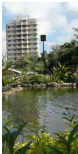
Parque Raphael Lazzuri