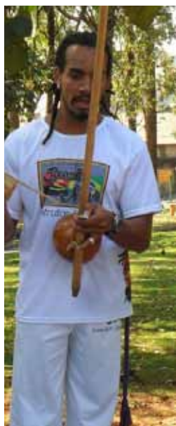
Roda de Capoeira