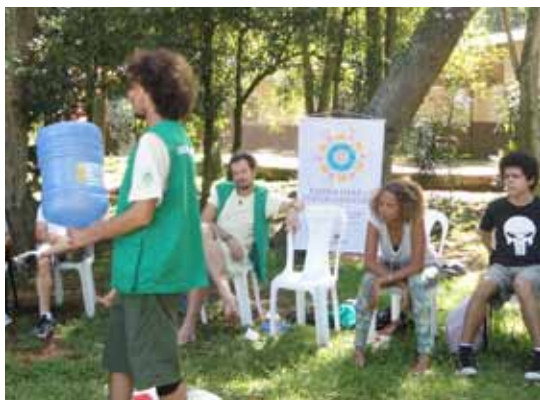
Atividade da Giranda da Sustentabilidade

domiliares é matéria orgânica, ou seja, resto de comida. Quando descartados de forma incorreta podem contaminar o solo, a água e o ar. Mas da maneira correta, com a utilização de técnicas de reciclagem, acaba se transformar em um rico adubo. Isso serve para a construção de minhocários domésticos, que são sistemas modulares que utilizam a ação das minhocas para transformar os resíduos em húmus. Eles podem ser utilizados em residências pequenas, como apartamentos, ou em lugares maiores, como restaurantes. Aprenda a transformar lixo em húmus, permitindo que os nutrientes completem seu ciclo natural!