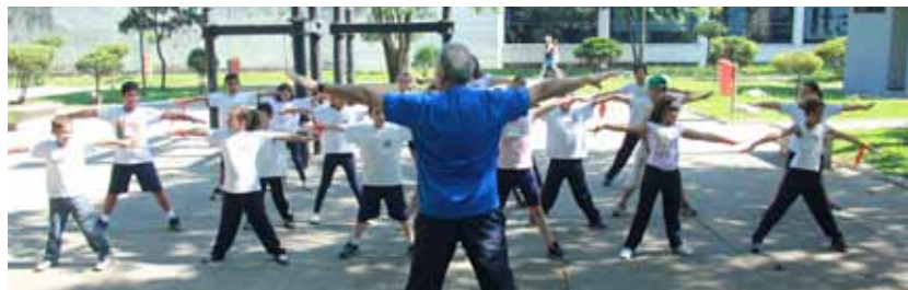
Praça dos Meninos, no Rudge Ramos

Participe e conheça um pouco mais de uma das antigas tradições brasileira. Para isso, os profissionais dessa arte e seus respectivos alunos realizam, em diversos locais da