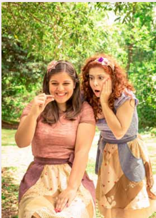
Grupo Três Marias e um João