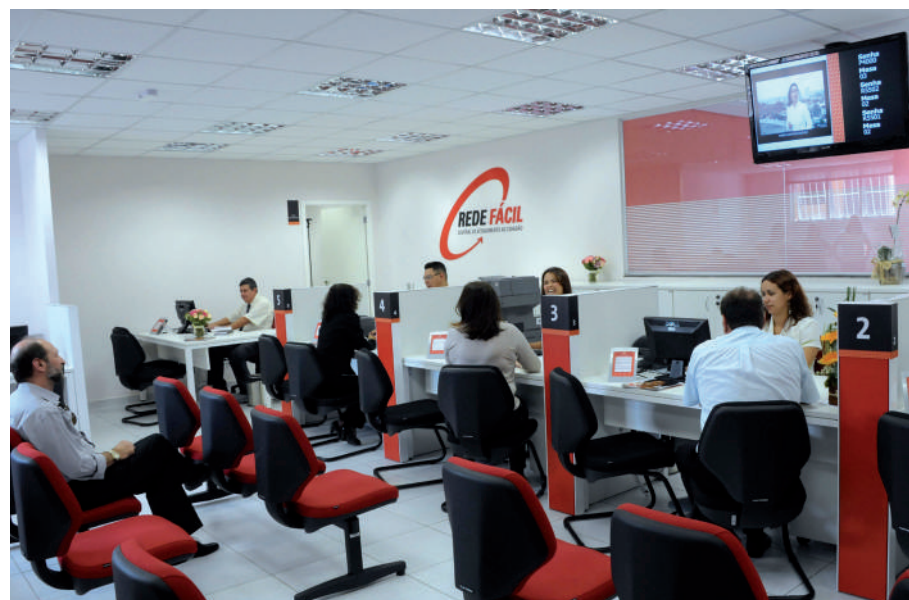
Adesão ao PPI pode ser feita na Rede Fácil do Paço, Assunção, Riacho e Alvarenga