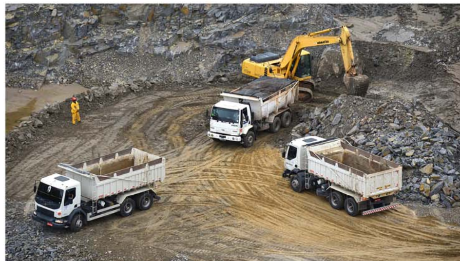
Piscinão vai ter capacidade para armazenar cerca de 200 milhões de litros de água