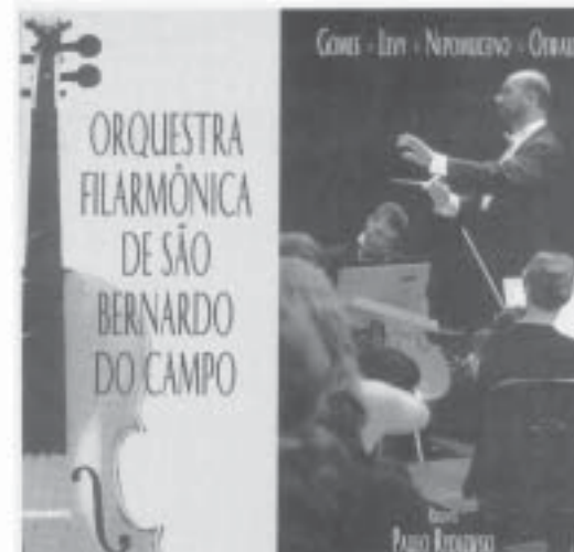
CD "Orquestra Filarmônica de São Bernardo do Campo"