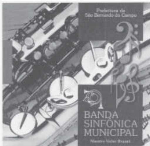
CD "Banda Sinfônica Municipal"