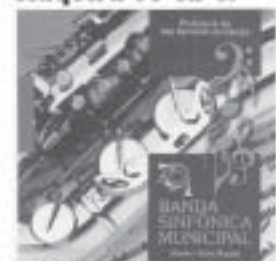
CD "Banda Sinfônica Municipal"