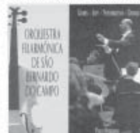
CD "Orquestra Filarmônica de São Bernardo do Campo"