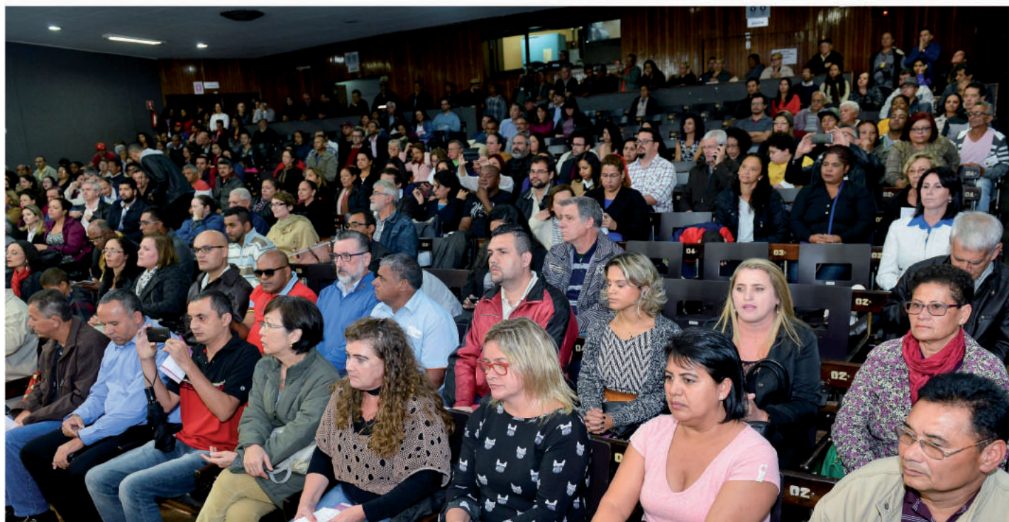
Planejamento de longo prazo garantiu, por exemplo, Hospital de Clínicas, 7 Centros Educacionais Unificados e nove UPAs