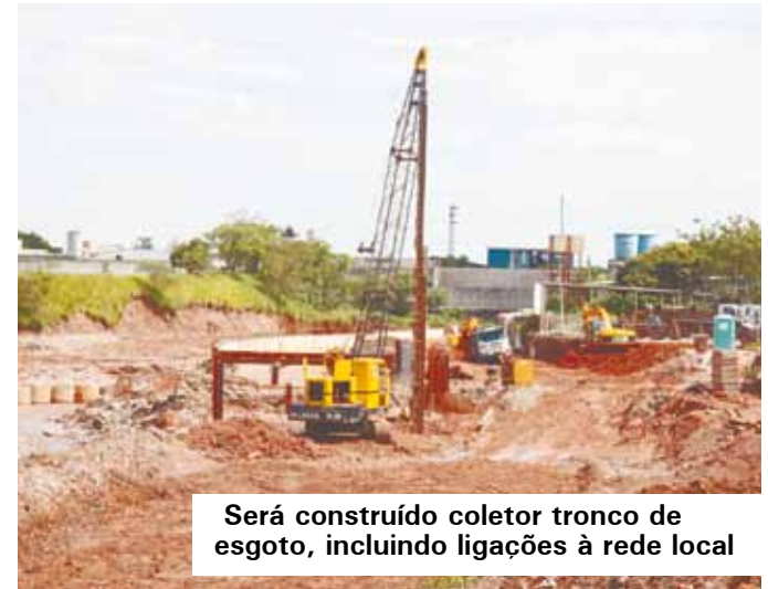
Será construído coletor tronco de esgoto, incluindo ligações à rede local

de veículos, reduzindo o congestionamento do entorno da Av. Piraporinha e Corredor ABD. Será criado um novo acesso ao bairro Jordanópolis e ligação ao Anel Viário Metropolitano, fazendo conexão com Santo André e Diadema. Também será facilitado o deslocamento dos motoristas da Região do Alvarenga aos bairros Paulicéia, Taboão e Rudge