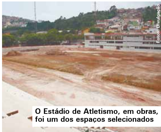
O Estádio de Atletismo, em obras, foi um dos espaços selecionados

Handebol Brasileiro, o Estádio de Atletismo, o Centro de Canoagem (no Parque Estoril), o Estádio Primeiro de Maio, o Estádio do Baetão e o Ginásio Poliesportivo. Dos seis equipamentos, os três primeiros estão em construção. Essas instalações serão apresentadas às seleções durante os Jogos Olímpicos de Londres, em 2012. O processo de seleção durou um mês e teve o objetivo de identificar espaços que atendessem aos requisitos técnicos e recomendações das federações esportivas internacionais. “Dos 46 locais escolhidos no Estado de São Paulo, mais de 10% estão em São Bernardo. Essa escolha é um prêmio para um município que coloca o esporte e lazer como prioridades”, afirma o secretário de Esportes e Lazer.