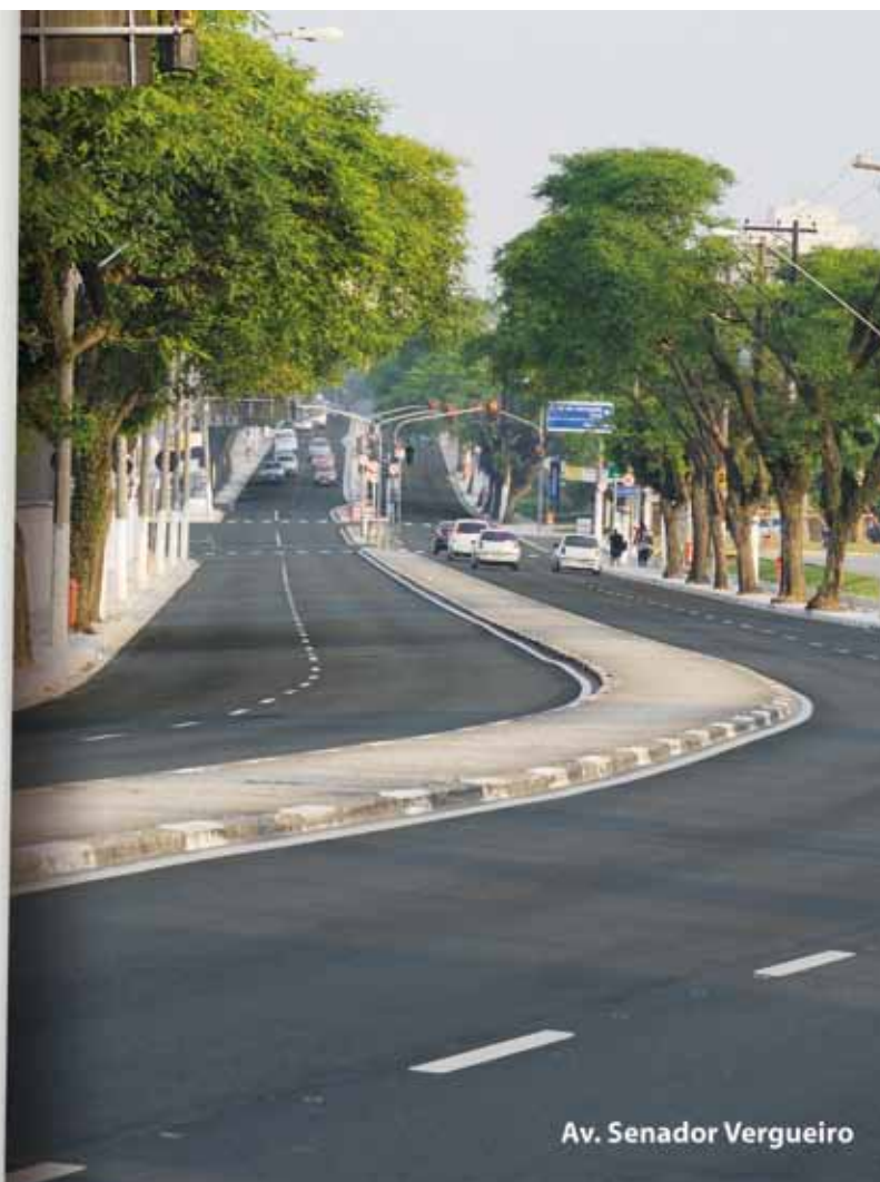
Av. Senador Vergueiro