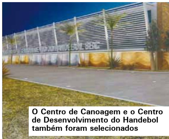
O Centro de Canoagem e o Centro de Desenvolvimento do Handebol também foram selecionados