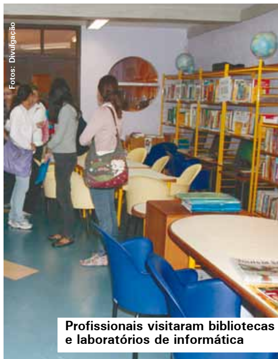
Profissionais visitaram bibliotecas e laboratórios de informática

recebendo capacitação, e os outros foram conhecer Escolas Municipais de Educação Básica (Emeb) localizadas em bairros periféricos, como Vila São Pedro, Montanhão, Riacho Grande e Alvarenga. “Além de uma série de informações sobre o funcionamento da nossa rede, também demos capacitação por três dias sobre formação pedagógica, grade curricular, programas, parcerias e, acima de tudo, reforçamos nosso compromisso com a Educação de São Bernardo. Todos entenderam que no município o ensino é inclusivo e o envolvimento da comunidade também faz parte desse processo”, ressaltou a secretária.