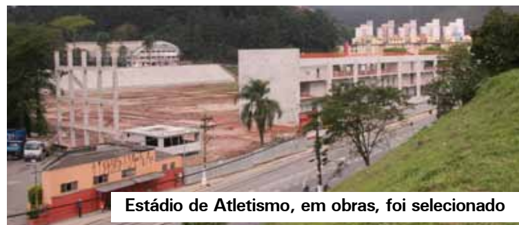
Estádio de Atletismo, em obras, foi selecionado

Novos profissionais da Educação recebem boas-vindas e formação antes do início do ano letivo