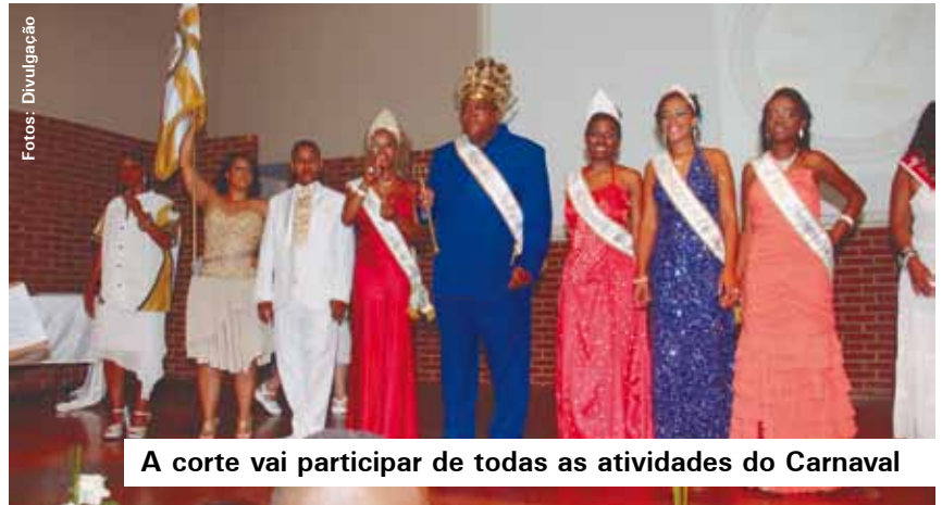
A corte vai participar de todas as atividades do Carnaval

já me aconteceu", declarou. Na disputa, pesaram quesitos como estética, beleza, comunicação e samba no pé. Com a festa, foram arrecadados 525 quilos de alimentos não perecíveis, que serão doados à ONG Atitude Vida, do Jardim Irajá. Serviço O Carnaval 2012 será realizado dias 18 e 19 de fevereiro, na Av. Aldino Pinotti, próximo ao Paço Municipal.