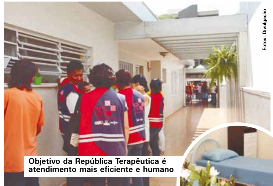
Objetivo da República Terapêutica é atendimento mais eficiente e humano

temos alcançado resultados muito positivos", cita. A nova unidade terá capacidade para atender até 15 pessoas, que irão morar no local e participar de projetos terapêuticos e de geração de renda desenvolvidos pelo Centro de Atenção Psicossocial (Caps) de Álcool e Drogas. Cuidadores atuarão 24 horas na República, além de um técnico de nível superior. Serão feitas visitas às famílias dos acolhidos com o objetivo de resgatar os vínculos familiares e os pacientes poderão ser incluídos em projetos de geração de renda e formação profissional.