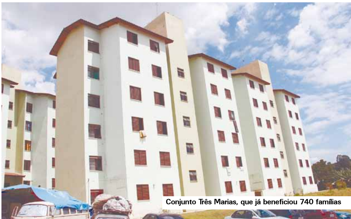
Conjunto Três Marias, que já beneficiou 740 famílias