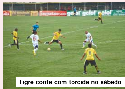
Tigre conta com torcida no sábado