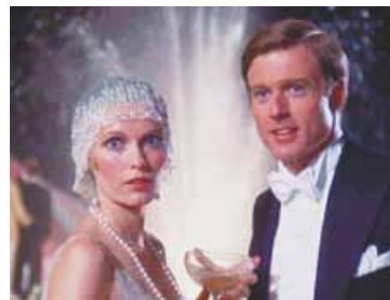
O grande Gatsby