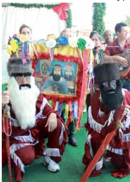
Folia de Reis é uma tradição na cidade