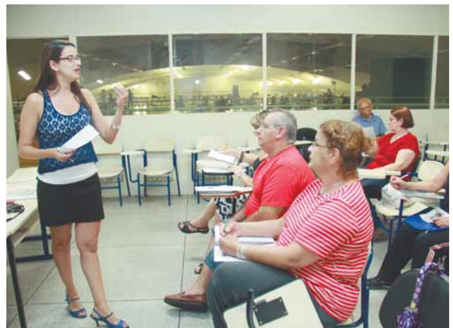
Como o ensino não se baseia em provas, aluno escolhe disciplina que quer cursar