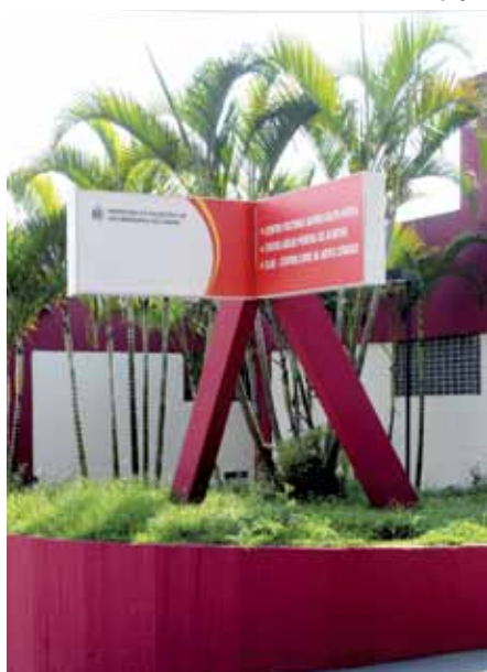
Clac no Baeta Neves