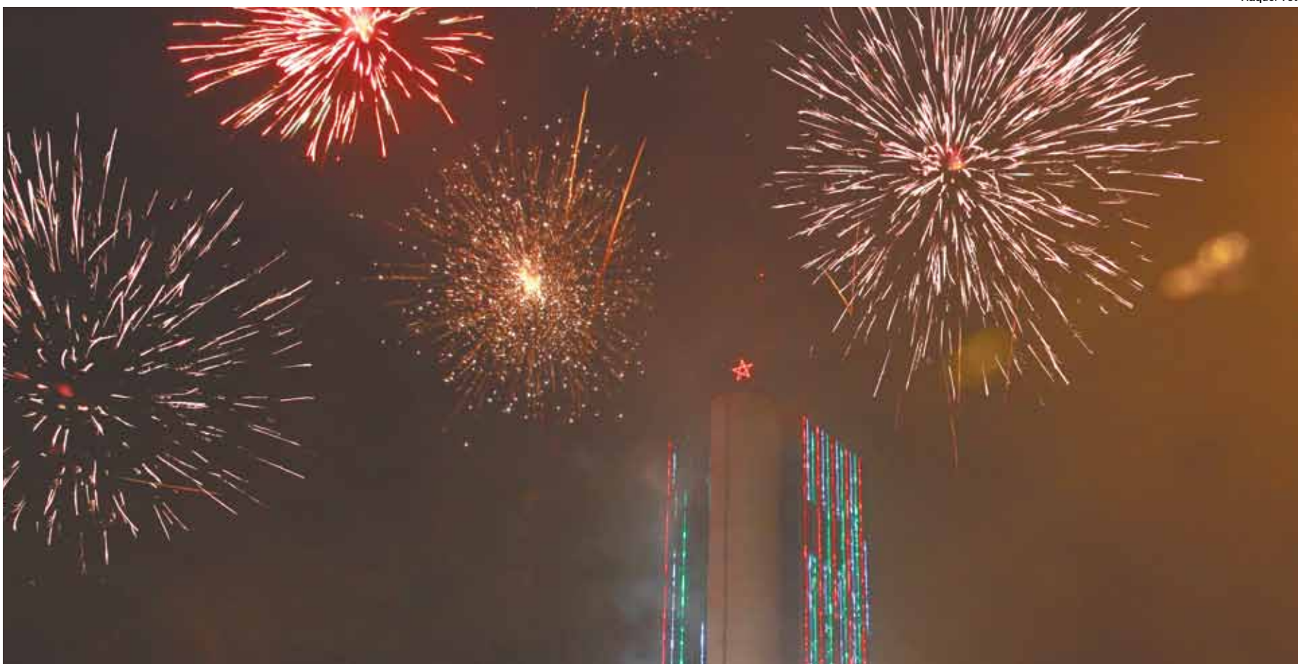
Com o prédio da Prefeitura, no Paço, transformado em árvore de Natal, 2014 chegou com uma grande queima de fogos de artifício animada com muita música