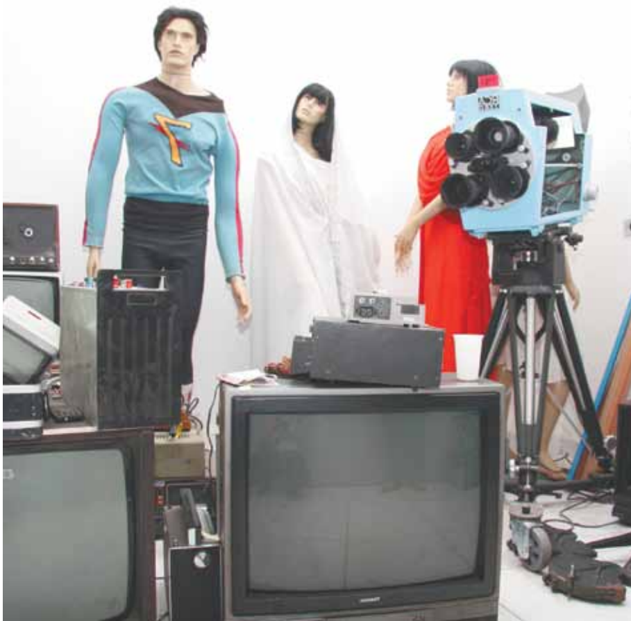
Espaço expõe foto da primeira imagem que foi ao ar na TV da América Latina

Cidade da Criança, Rua Tasman, 301, Jardim do Mar. De terça a domingo e feriados, das 9hs às 17h. Informações: 4330-9080