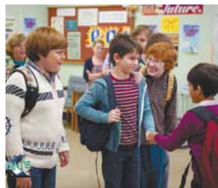
Diário de um banana

Cineclube Biblioteca de Arte Ilva Aceto Maranesi