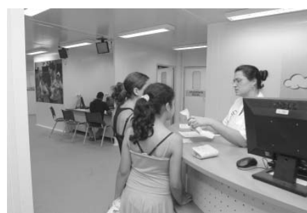
Três UPAs foram inauguradas em 2010

Pela primeira vez, o Hospital Anchieta realizou a retirada de órgãos para transplante. Outro importante benefício foi a ampliação do convênio com o hospital da Santa Casa para 22 leitos de clínica médica, consultas e exames em dermatologia, urologia, endoscopia digestiva e tomografia.