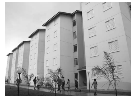
Entrega de 120 unidades no Jardim Silvina

No Jardim Esmeralda serão 564 moradias para realocação das famílias do próprio local. No Jardim Lavínia, o projeto contempla a construção de mais 184 apartamentos para moradores da própria área. No Jardim Colina, a urbanização vem junto com a produção de 100 novas unidades para remanejamento dos moradores locais e a consolidação de 103 moradias. Todos