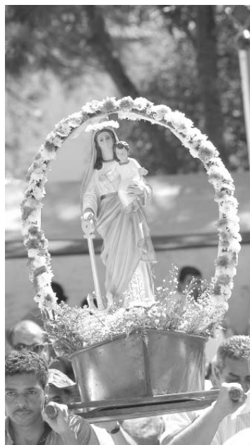
Festa é tradicional na região

Além das tradicionais missas, haverá shows musicais e uma exposição que aborda, através de painéis ilustrativos, um pouco da história do evento. A mostra será exibida na Praça João Olímpio Bassani, na Rua Araguaia, em