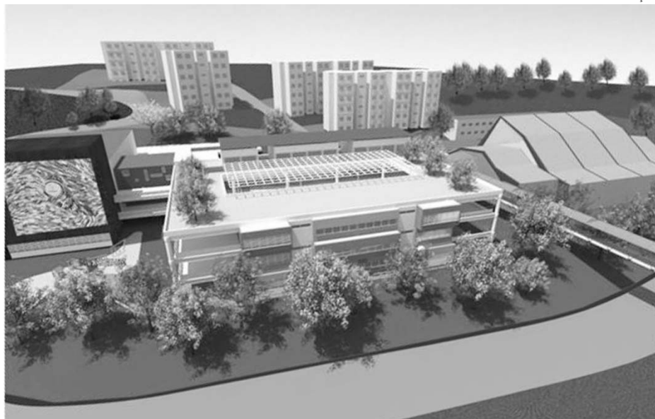
Obras do Centro de Educação Unificado (CEU) Três Marias foram iniciadas em dezembro

“Nesses dois anos de governo, São Bernardo do Campo provou que sua Educação é inclusiva e que a escola é realmente para todos”. A afirmação da secretária de Educação diz respeito às várias ações desenvolvidas pela pasta ao longo de 2010. Depois do levantamento feito no início da gestão, que apontou deficiências nas estruturas físicas das unidades escolares e o déficit de quase 12 mil vagas na rede, 2010 começou com as ações práticas da Pasta.