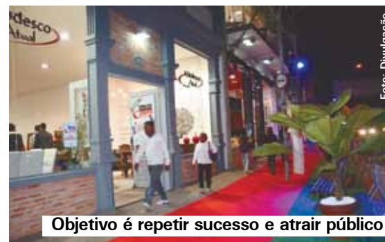
Objetivo é repetir sucesso e atrair público

haverá decoração ao longo da via, além de duas praças de alimentação. Nos finais de semana, os frequentadores poderão utilizar o estacionamento do Paço Municipal e se deslocar por meio de vans disponibilizadas pela Prefeitura até a Jurubatuba.