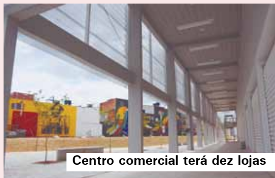
Centro comercial terá dez lojas

Durante a solenidade de entrega dos apartamentos no Sítio Bom Jesus neste sábado, a Prefeitura também entregará aos moradores do bairro a primeira etapa do parque linear construído no trecho da encosta do Córrego Alvarenga, que passou por obras de canalização. O espaço contará com playground, ciclovia e praça, além de projeto