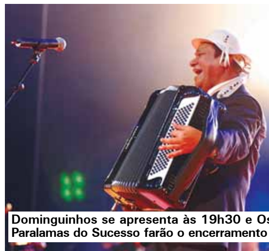
Dominginhos se apresenta às 19h30 e Os Paralamas do Sucesso farão o encerramento

Teatros ainda têm datas vagas para ocupação