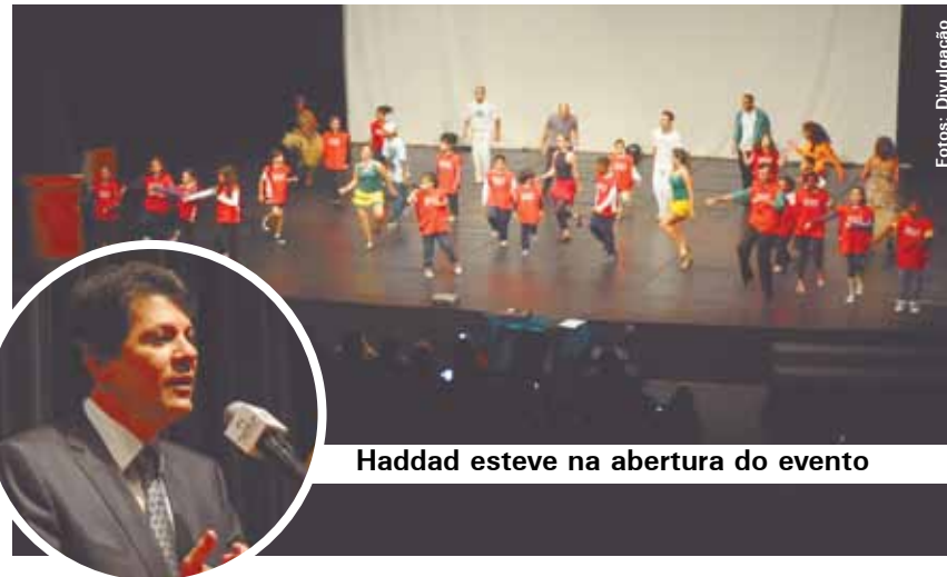
Haddad esteve na abertura do evento

públicas, foi organizado pelo Comitê Estadual de Educação Integral, colegiado composto por representantes dos municípios de São Paulo e que contam com o Programa do Governo Federal de Educação Integral, o Mais Educação. Secretários das 30 cidades que compõem o Comitê Estadual, entre as quais São Bernardo, Mauá, Santo André e Diadema estiveram presentes. A proposta foi ampliar as discussões sobre os rumos e os impactos do Programa Mais Educação na Grande São Paulo. Presente na abertura do evento, Fernando Haddad disse que o evento pode trazer subsídios ao novo rumo da educação no País. "O Programa Mais