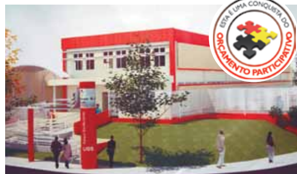
UBS do Pq. São Bernardo antes da reforma e projeto de como ficará após as obras