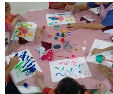
Recreação externa, Sala de estudo e Atividades lúdicas