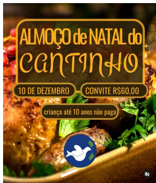
Festas para arrecadação