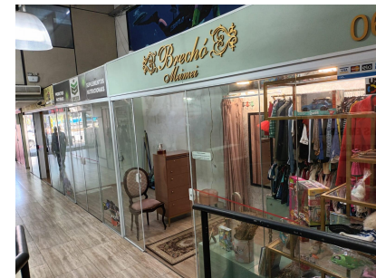
Bazar, Pechinção e Brechó da Meimei