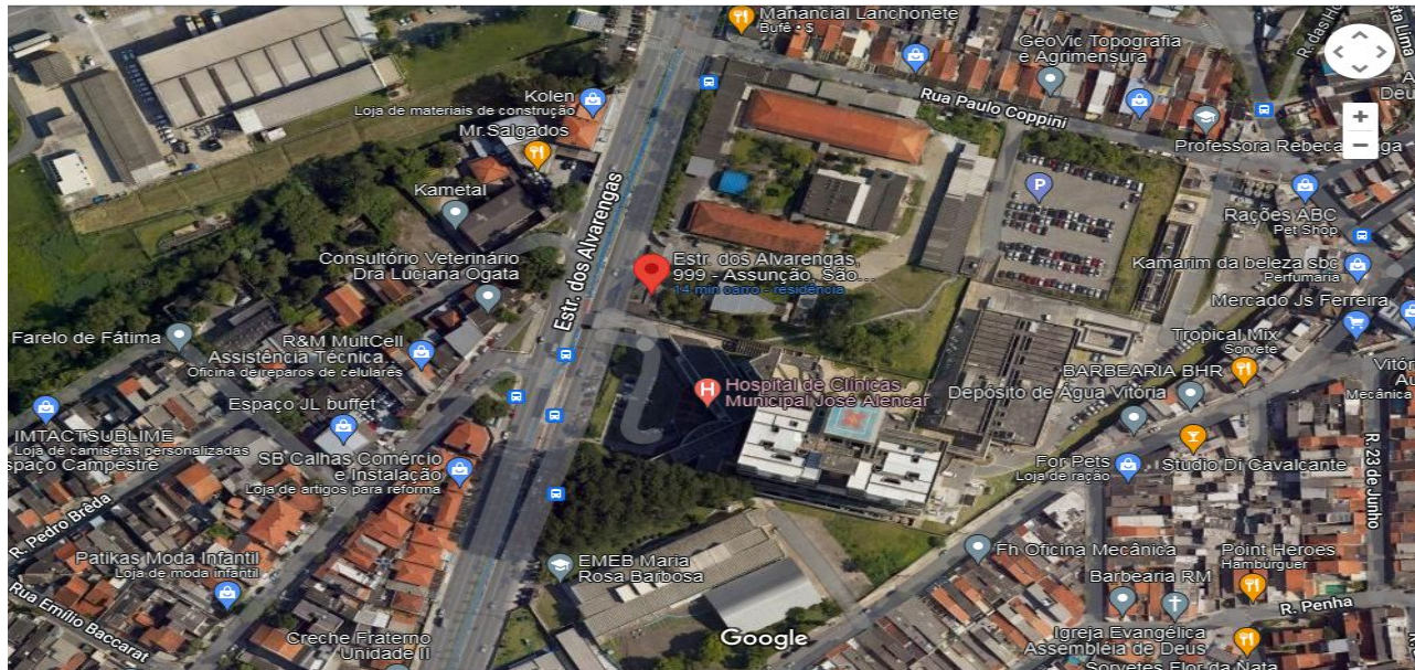
FOTO DO BAIRRO