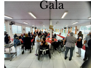
Desfile de Gala