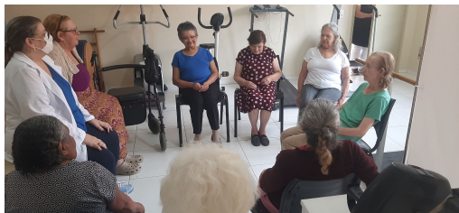
Grupo de Fisioterapia voltado ao público feminino