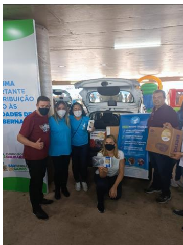
Entrega do Kit Digital - Cenforpe