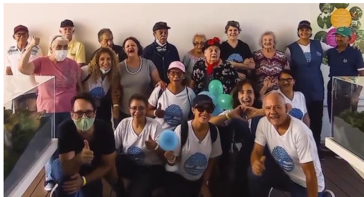
Passeio para o Parque Ecológico Imigrantes.