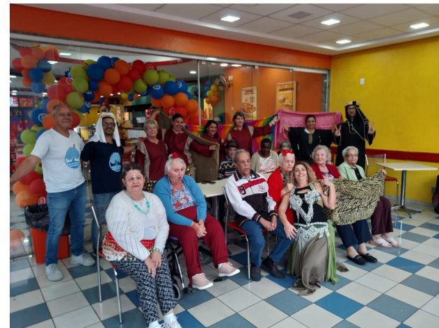
Oficina de dança do ventre no Habib's