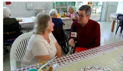
Empresas criam iniciativas para reaproveitar comida que iria para o lixo