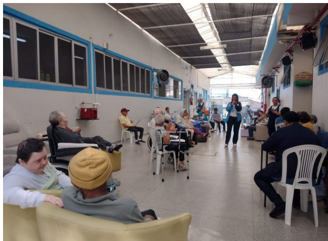
Atividade Boas novas de Deus para sua vida.