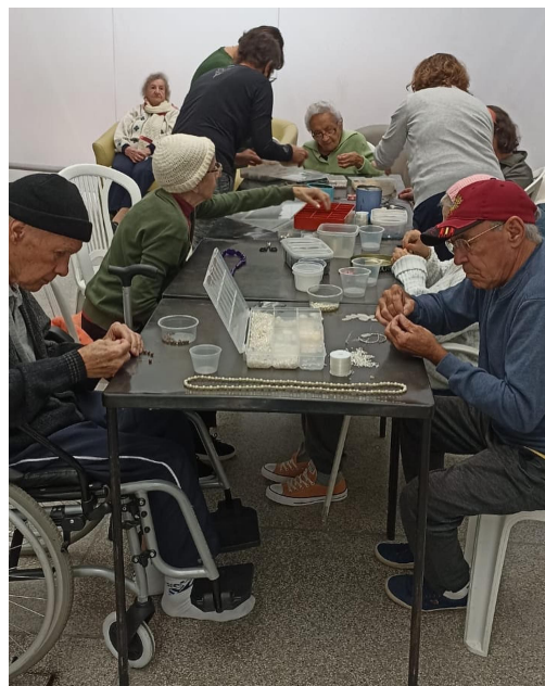
Oficina de confecção de bijuteria.