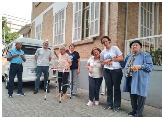
Coral da universidade Mackenzie