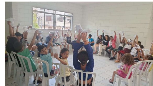
Campanha inverno solidário FSS