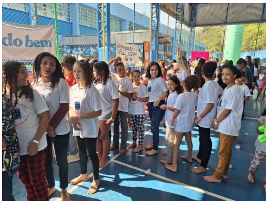
Hamburgada do Bem