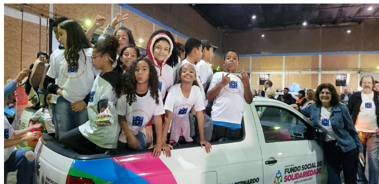
Recebemos a doação da picape do FSS