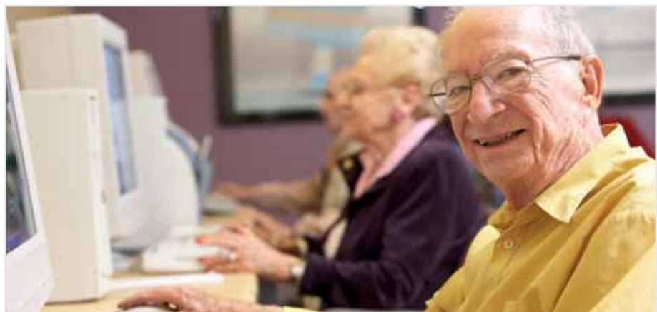
Sala de aula: faculdade ajuda idosos a criar novos círculos de amizade

A Fati oferece a seus participantes atividades intelectuais, físicas e de lazer. Mais do que simplesmente estudar sobre temas como saúde, direito e cultura, os alunos da Fati ganham a oportunidade de se relacionar com outras pessoas da terceira idade e criar