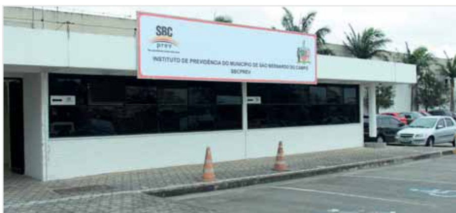
Comodidade: novas instalações oferecem estacionamento e fácil acesso

O objetivo do SBCPrev é fazer com que todo o processo de aposentadoria dos seus segurados