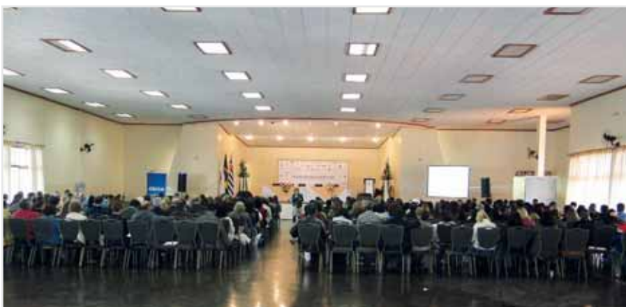
Troca de experiências: encontro atraiu 500 pessoas em 2012

O ponto alto do esforço de capacitação na área foi o I Encontro Municipal de Previdência Social, que atraiu cerca de 500 servidores ativos e aposentados em 2012. O evento foi realizado pelo