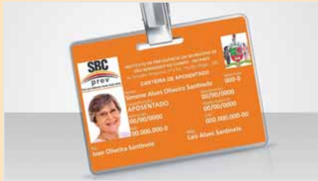
Peça o seu: basta comparecer à sede do SBCPrev

Se tiver dúvidas sobre o recadastramento, entre em contato pelo 11-4336-9237 ou visite o site www.sbcprev.saobernardo.sp.gov.br ou compareça à sede do SBCPrev.